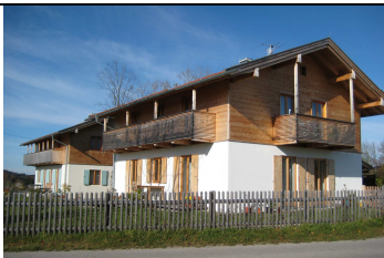
16:15 – 16.45 Wackersberg