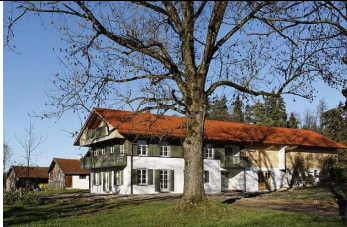
15:15 – 15.45 Bad Heilbrunn