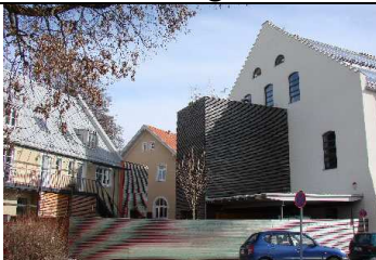
17:00 – 17.30 Bad Tölz