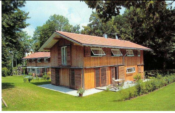
11:45 – 12.15 Dietramszell