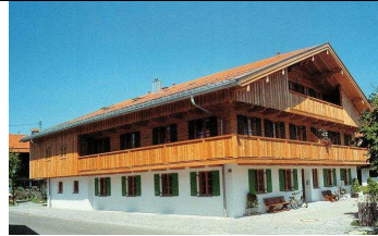
14:15 – 14.45 Greiling